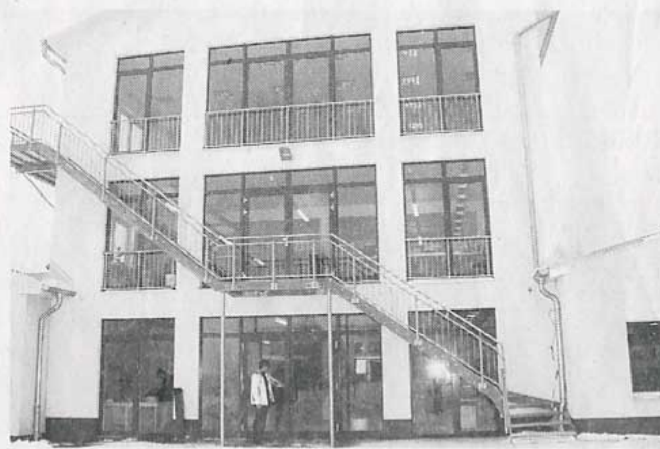
Der Neubau entlastet das Haupthaus.

Gestoppt wurde das Bauvorhaben auch, weil man beim Aushub für das Fundament auf Keramik-Reste gestoßen war. Der hinzugezogene Archäologe kam allerdings zu dem Schluss, dass die Scherben erst rund einhundert Jahre alt und somit völlig wertlos sind.