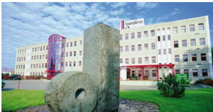
Energieverbrauch um 30 Prozent gesenkt: Das berolina-Werk im brandenburgischen Zossen

Die umweltfreundlichen Verbrauchsmaterialien sind jedoch nur ein Teil des Konzepts. Mit der All-In-Garantie bietet berolina eine Lösung, die effizienteres und damit energiesparendes Drucken von Geschäftsdokumenten ermöglicht. Nach intensiven persönlichen Gesprächen mit dem Kunden wird dessen Druckerlandschaft optimiert. Bestehende Geräte, die wirtschaftlich und ökologisch unbedenklich sind, werden beibehalten. Ineffiziente Geräte, veraltete „Dreckschleudern“ und „Energiefresser“ werden durch moderne Geräte ersetzt, der Gerätepark wird insgesamt reduziert – weniger Drucker benötigen weniger Energie. „Wir empfehlen immer nur das Gerät, das am besten für den spezifischen Einsatzzweck und Arbeitsplatz geeignet ist“, so Busch.