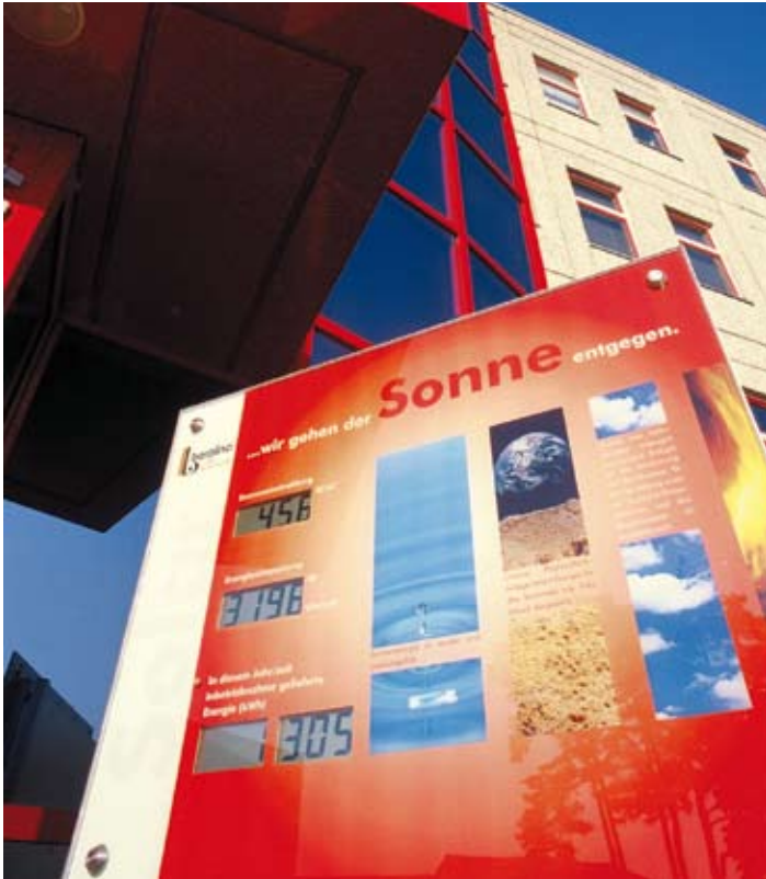
Wieviel Strom die hauseigene Solaranlage gerade erzeugt, ist auf der Hinweistafel am Haupteingang immer aktuell abzulesen.

Bekanntheitsgrad. Deshalb schien es uns nur logisch, beide Standards einzusetzen. Von der Validierung und der Zertifizierung versprechen wir uns auch handfeste unternehmerische Vorteile. Da ISO 14001-zertifizierte Unternehmen nach permanenter Umweltverbesserung streben, kaufen sie bevorzugt bei umweltfreundlichen Lieferanten. Und so fordern gerade die Kunden, die ihrerseits zertifiziert sind, das Zertifikat ab.“ berolina verschickt rund 8.000 Zertifikate pro Jahr allein an seine Kunden. Darüber hinaus spielt die Zertifizierung nach ISO 14001 eine große Rolle bei öffentlichen Ausschreibungen.