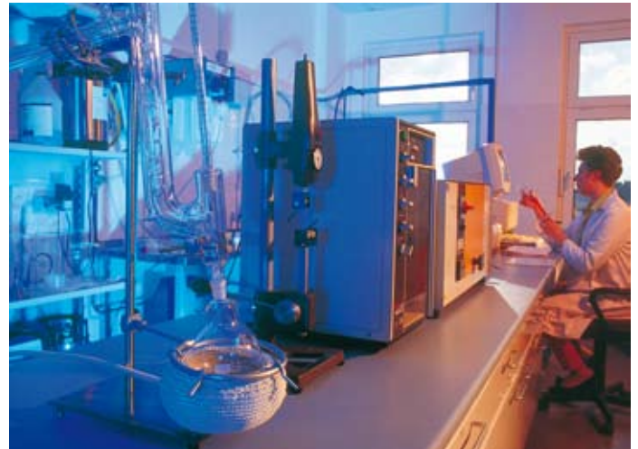
Qualität und Nachhaltigkeit sind oberste Ziele bei der berolina Forschung und Entwicklung