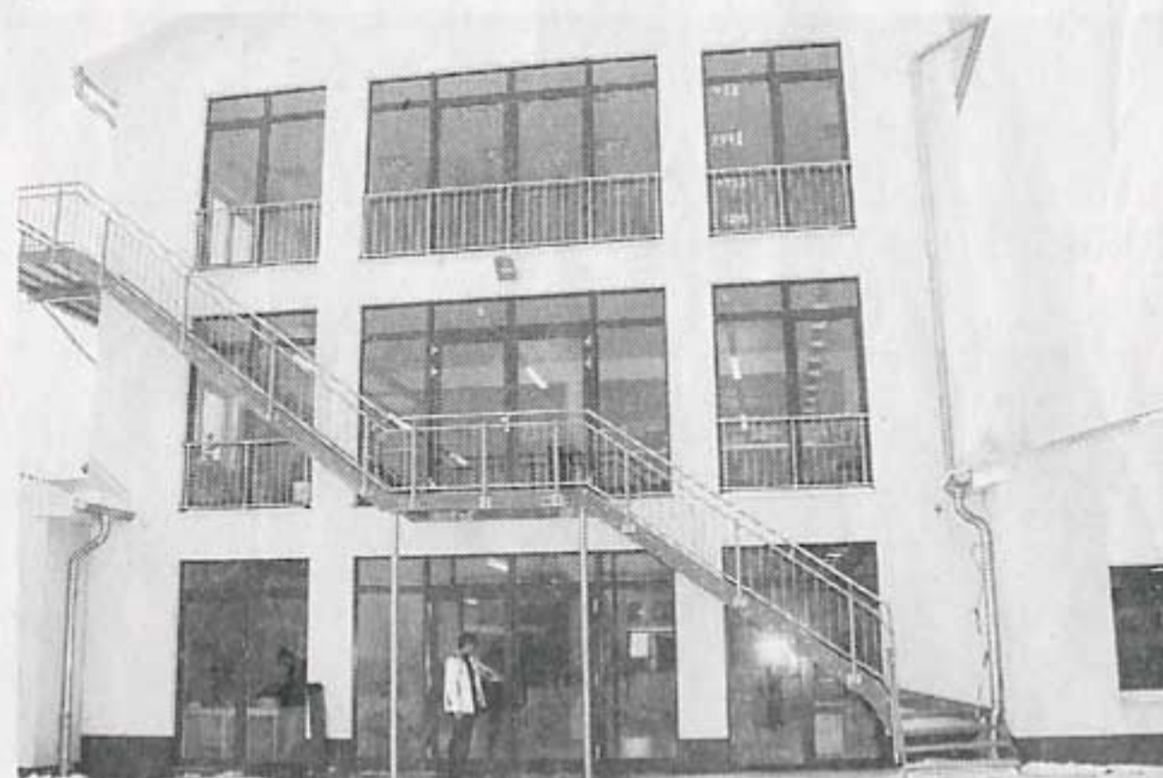
Der Neubau entlastet das Haupthaus.

Gestoppt wurde das Bauvorhaben auch, weil man beim Aushub für das Fundament auf Keramik-Reste gestoßen war. Der hinzugezogene Archäologe kam allerdings zu dem Schluss, dass die Scherben erst rund einhundert Jahre alt und somit völlig wertlos sind.